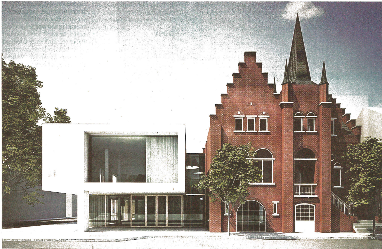
Gewonnen maar niet gebouwd: gemeentehuis Wommelgem.